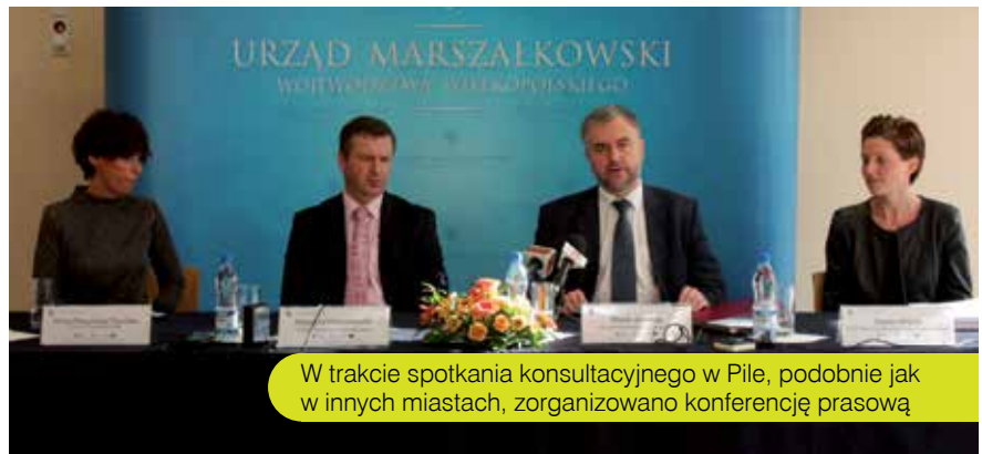
W trakcie spotkania konsultacyjnego w Pile, podobnie jak w innych miastach, zorganizowano konferencję prasową

Ostatnim etapem przed negocjacjami z KE będzie przyjęcie ostatecznego projektu WRPO przez Zarząd Województwa. Zatwierdzony dokument zabierze wielkopolska delegacja na pierwszą rundę negocjacji do Brukseli. Jak długo mogą potrwać rokowania? – Wiele zależy od wcześniejszych ustaleń na linii polski rząd – Bruksela. Jeżeli Komisja Europejska złagodzi warunki dotyczące zakazu finansowania dróg lokalnych z pieniędzy unijnych czy finansowania przedsięwzięć turystycznych, to te kwestie nie będą poruszane w rozmowach z regionami. Wtedy na stole znajdują się tylko sprawy specyficzne dla danego województwa. W tym zakresie będziemy bardzo do-