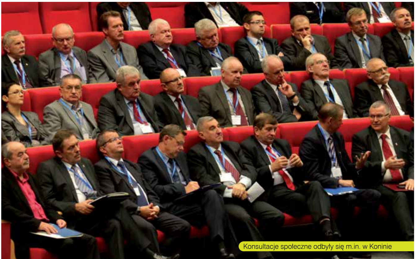
Konsultacje społeczne odbyły się m.in. w Koninie

P lonem ogólnowojewódzkiej debaty nad projektem jest ponad 200 uwag zgłoszonych w trakcie dyskusji lub drogą mailową. Na ostateczny kształt najważniejszego dla Wielkopolski w kolejnej unijnej perspektywie finansowania dokumentu, oprócz uwag zgłoszonych przez uczestników konsultacji, wpływ będą mieć także wnioski wynikające z przygotowywanej obecnie Prognozy oddziaływania na środowisko projektu WRPO 2014+ oraz ocena „ex ante” programu.