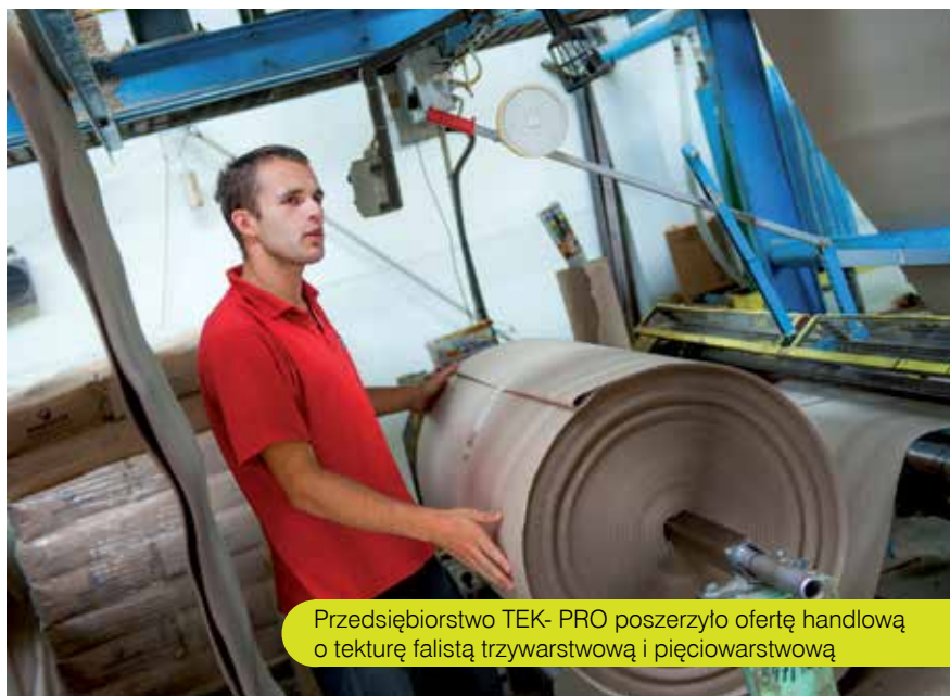
Przedsiębiorstwo TEK- PRO poszerzyło ofertę handlową o tekturę falistą trzywarstwową i pięciowarstwową

wa składa się z papieru zewnętrznego oraz warstwy falowanej, najnowszy produkt natomiast – tektura trzywarstwową – to dwa arkusze zewnętrzne gładkiego papieru i jeden wewnętrzny, zwany falą. To najbardziej uniwersalny materiał używany przy produkcji opakowań jednostkowych i zbiorczych. Jego zaletą, jakiej nie posiada tektura dwuwarstwową, jest możliwość wykonywania estetycznych i efektownych nadruków na całej powierzchni opakowania.