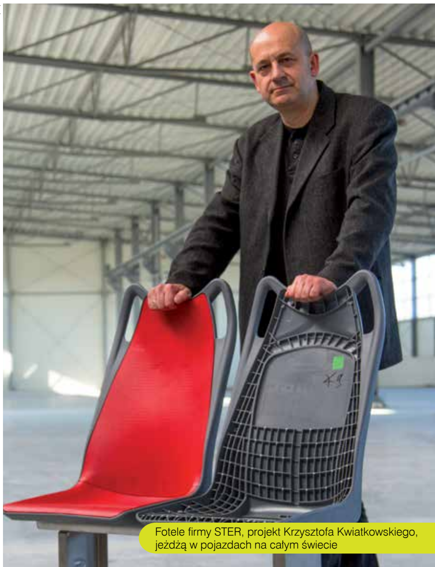
Fotele firmy STER, projekt Krzysztofa Kwiatkowskiego, jeżdżą w pojazdach na całym świecie

Pasażerowie rzadko zastanawiają się, jak powstają fotele do autobusów, tramwajów czy pociągów. Fotele mają decydujący wpływ na naszą ocenę estetyki pojazdów. Ale jednocześnie są produktem skomplikowanym pod względem konstrukcyjnym i materiałowym. – Przepisy unijne zmuszają producentów do zmniejszania masy pojazdów – wyjaśnia dr Krzysztof Kwiatkowski, projektant i wykładowca na Uniwersytecie Artystycznym w Poznaniu. – Żywotność autobusów w transporcie miejskim wynosi 15 lat. Dzięki „odchudzeniu”