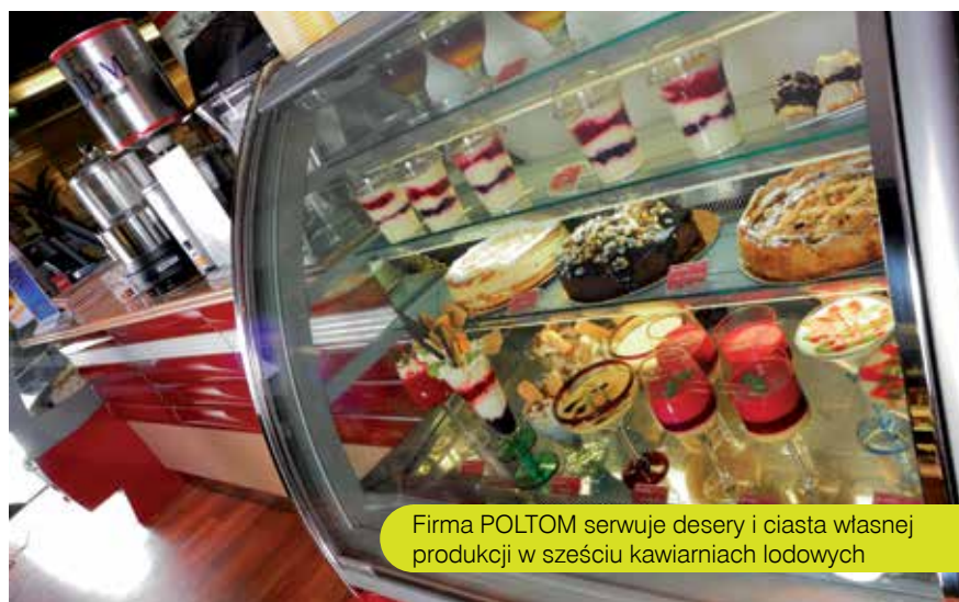
Firma POLTOM serwuje desery i ciasta własnej produkcji w sześciu kawiarniach lodowych

Małe rodzinne przedsiębiorstwa często potrafią doskonale wykorzystywać możliwości, jakie dają fundusze europejskie. Połączenie ciężkiej pracy ich właścicieli z korzystnymi instrumentami finansowymi takimi jak JEREMIE pozwalają rozwijać działalność poprzez zwiększenie konkurencyjności, dywersyfikację produkcji czy też rozbudowę sieci sprzedaży. Przedsiębiorstwo Wielobranżowe POLTOM od 35 lat zajmuje się produkcją lodów i wyrobów cukierniczych. Pierwsza firmowa lodziarnia „Śnieżynka” powstała w 1978 r. w Pile. Dziś firma serwuje desery i ciasta własnej produkcji w sześciu kawiarniach lodowych, także w Trzciance i Wałczu. Wszystkie działają pod tą samą nazwą, bo „Śnieżynka” stała się już rozpoznawalną lokalną marką.